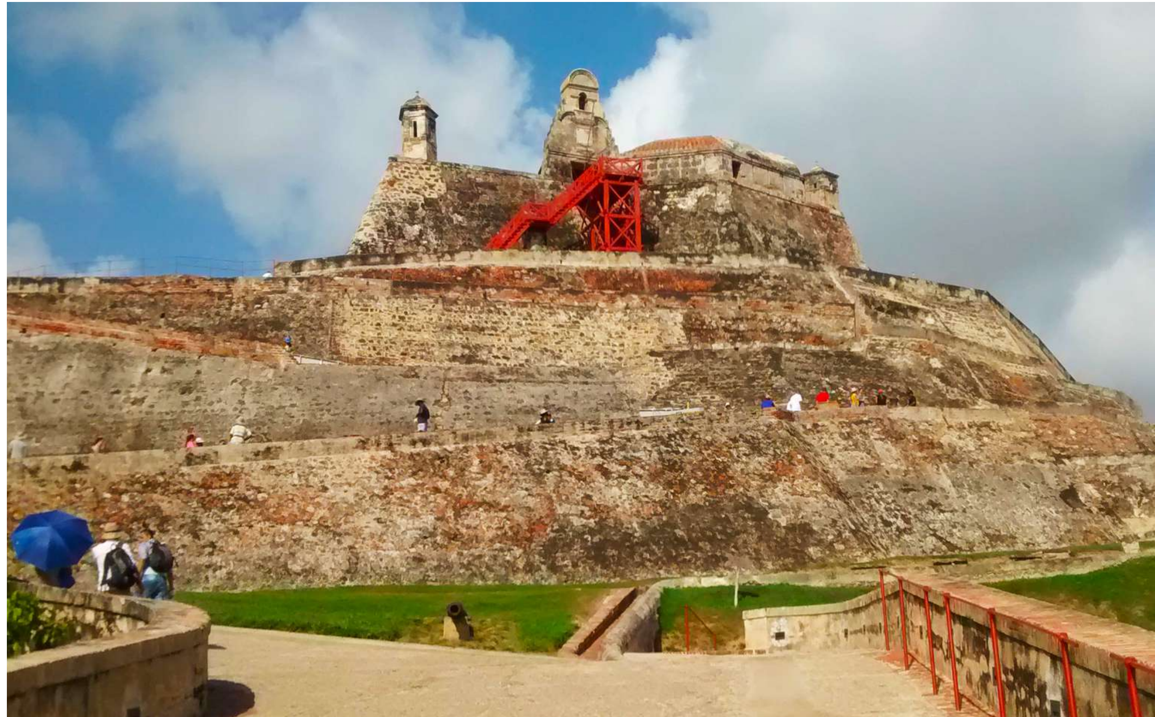
Castillo de San Felipe