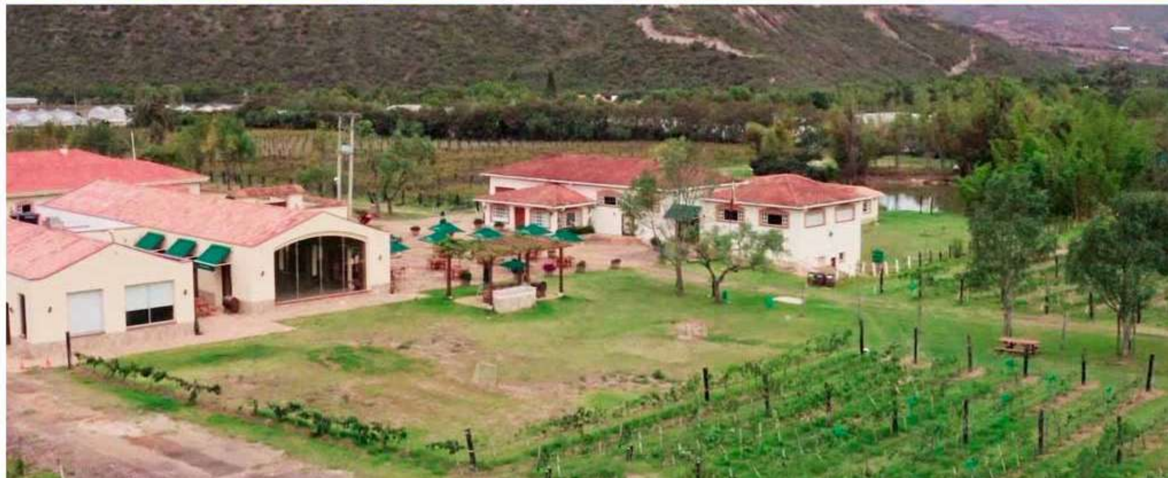
Viñedo Ain Karim