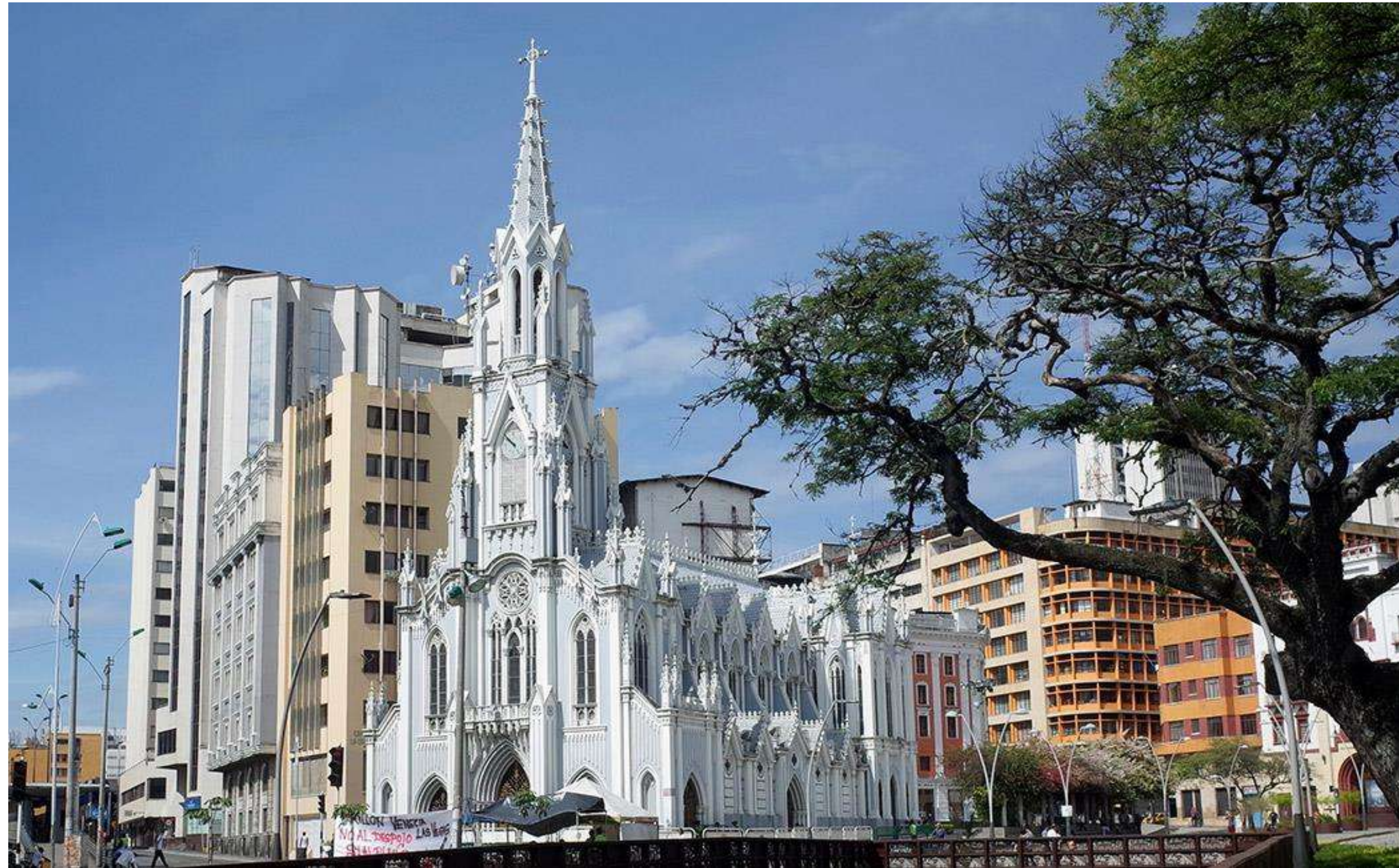
Iglesia La Ermita