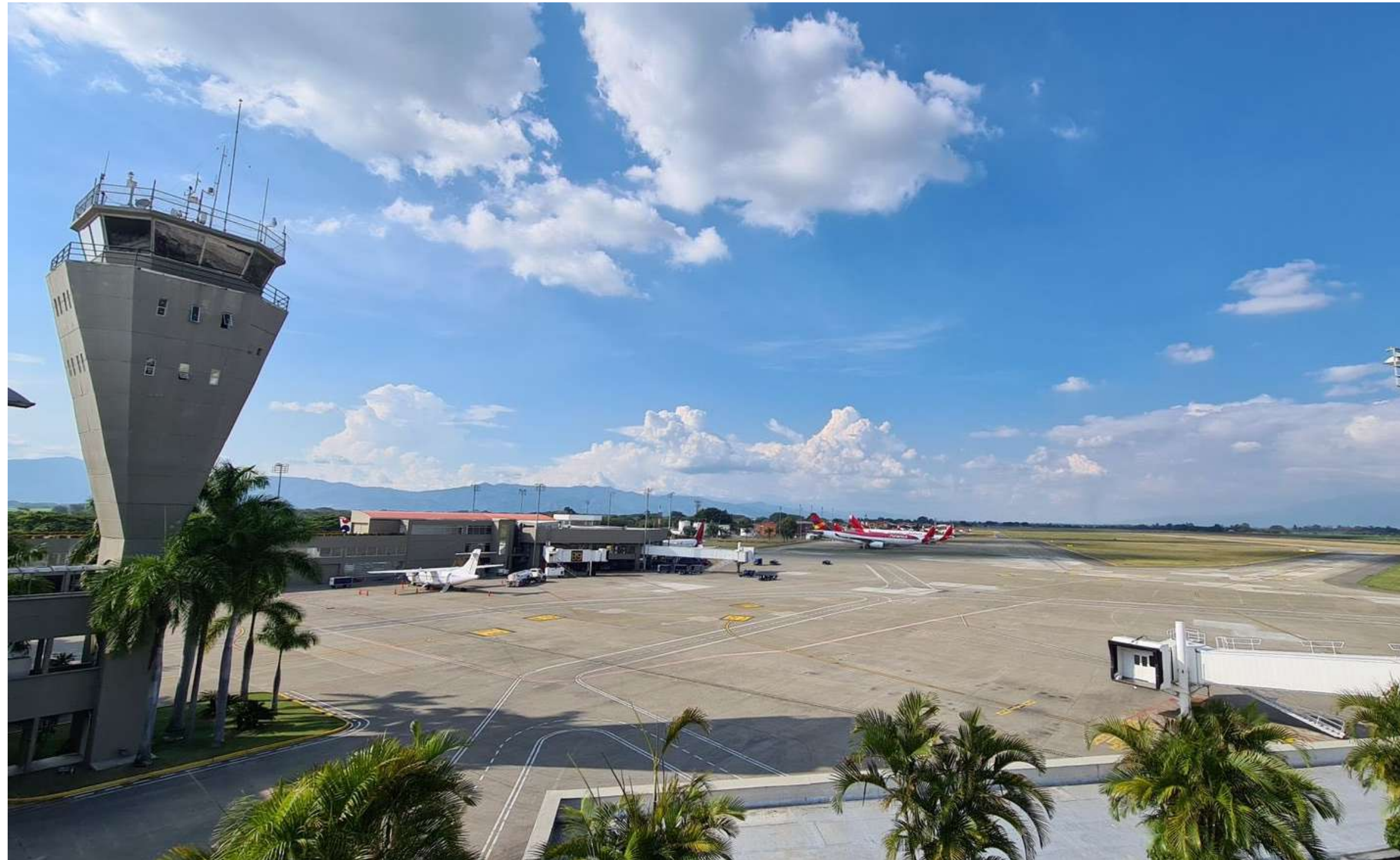
Aeropuerto Internacional de Cartagena