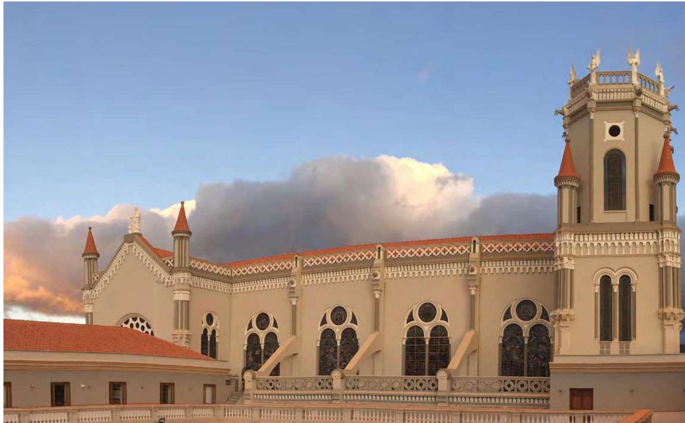
Templo de Cristo Rey