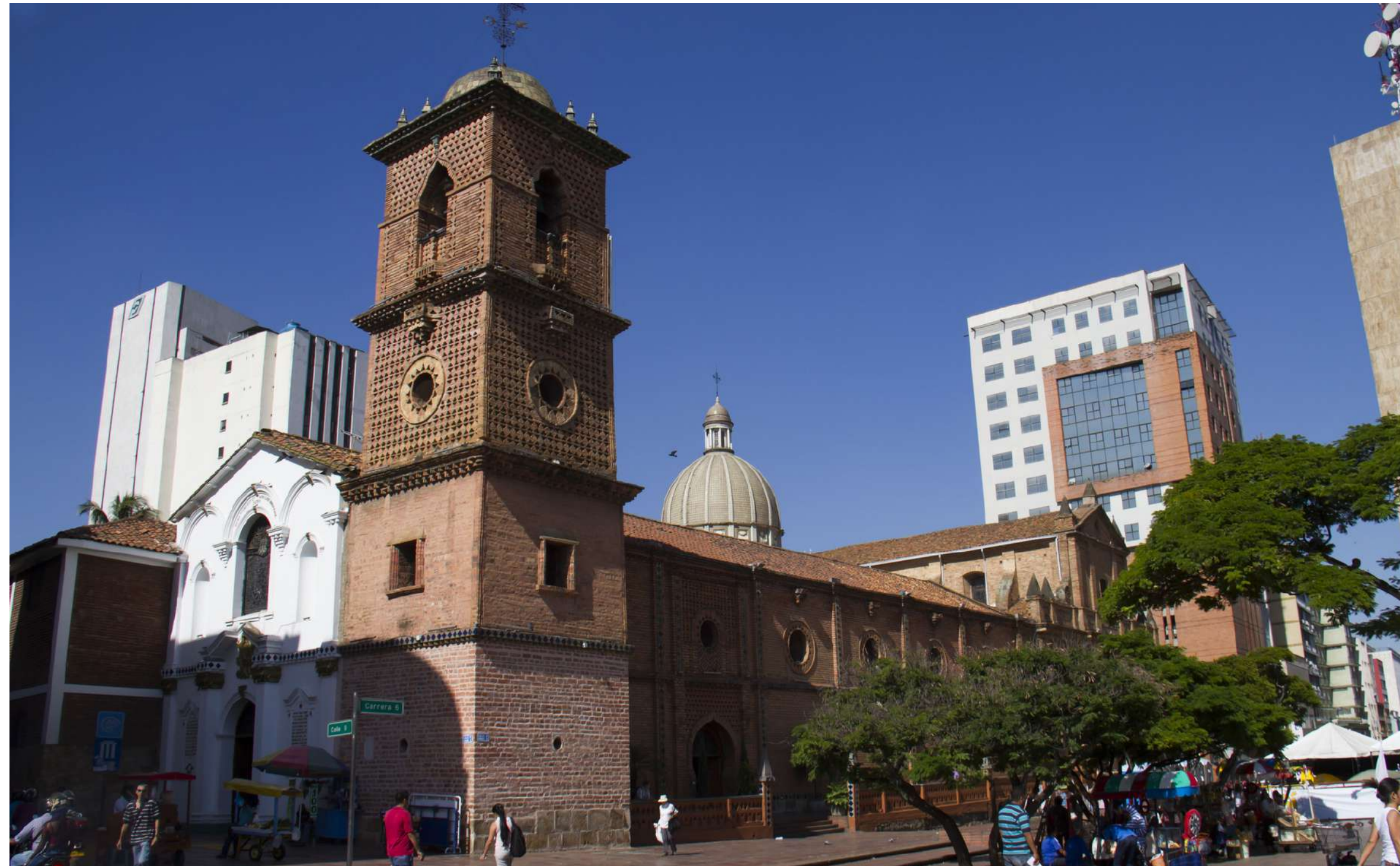
Complejo Religioso de San Francisco