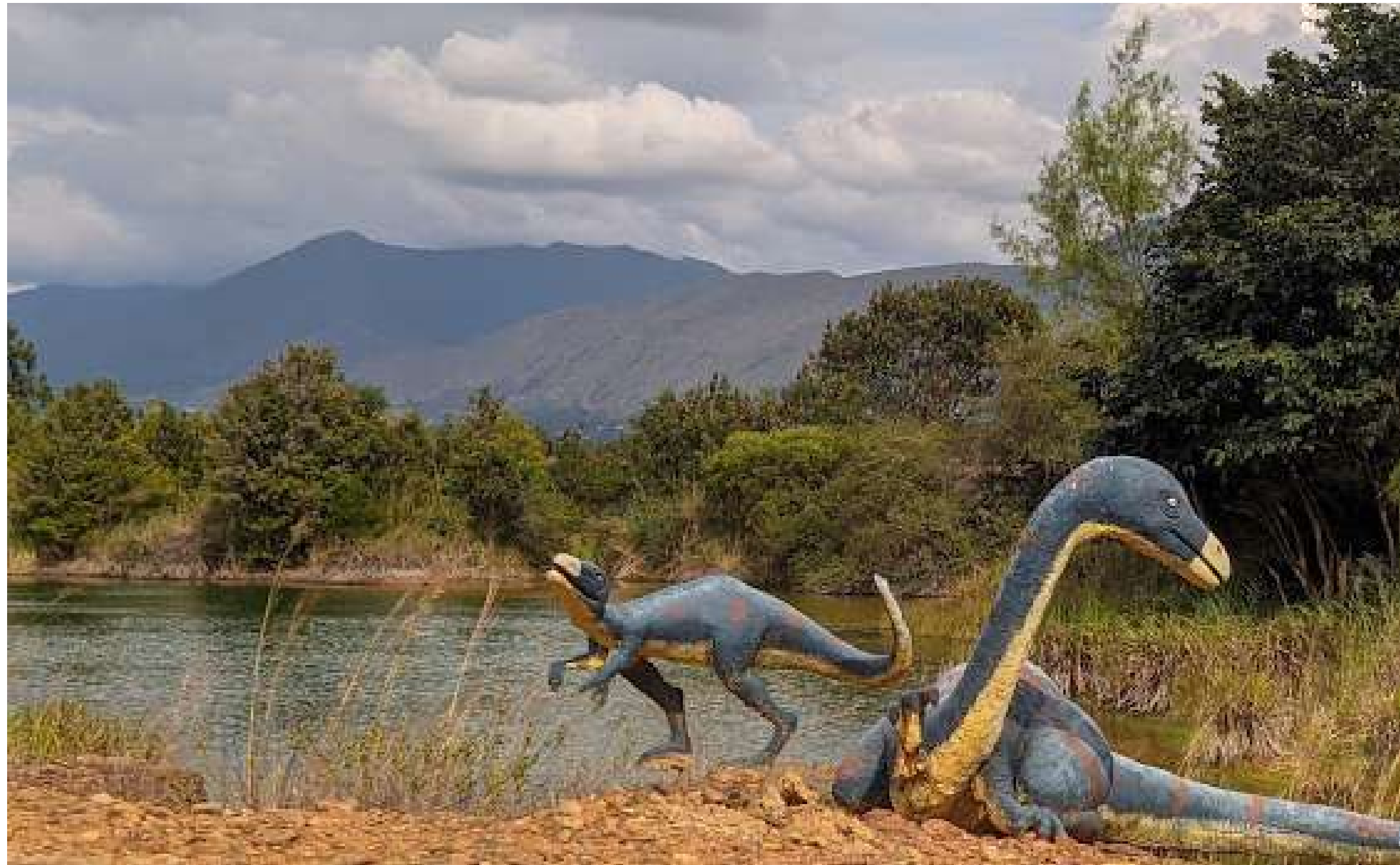
Gondav, el gran valle de los dinosaurios