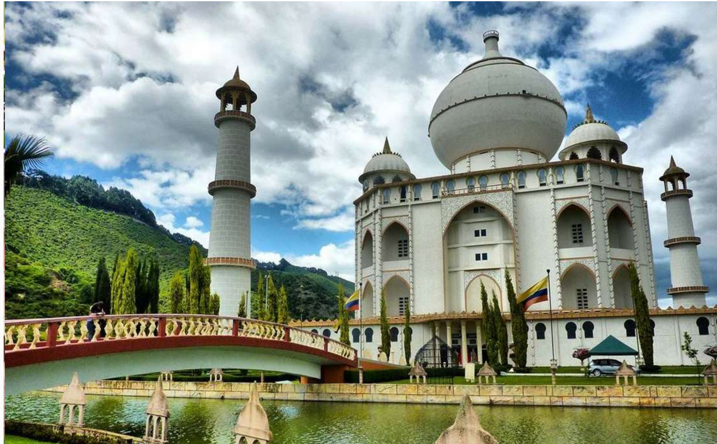
Parque Jaime Duque