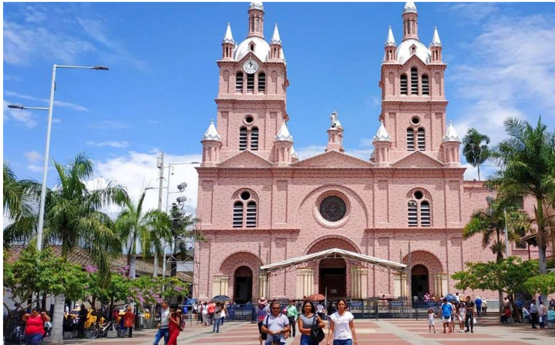
Basílica Menor del Señor de los Milagros