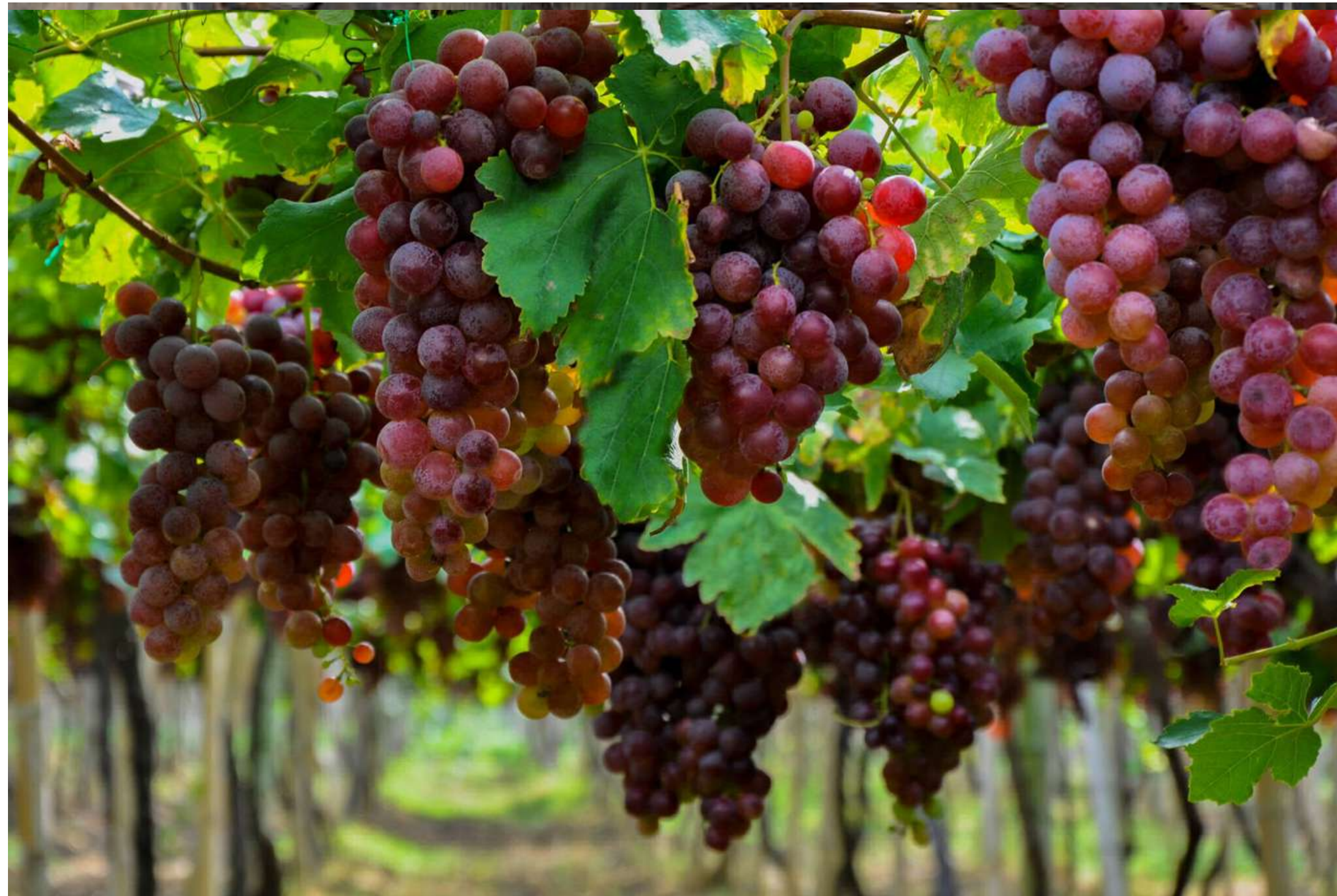
Parque Nacional de la Uva