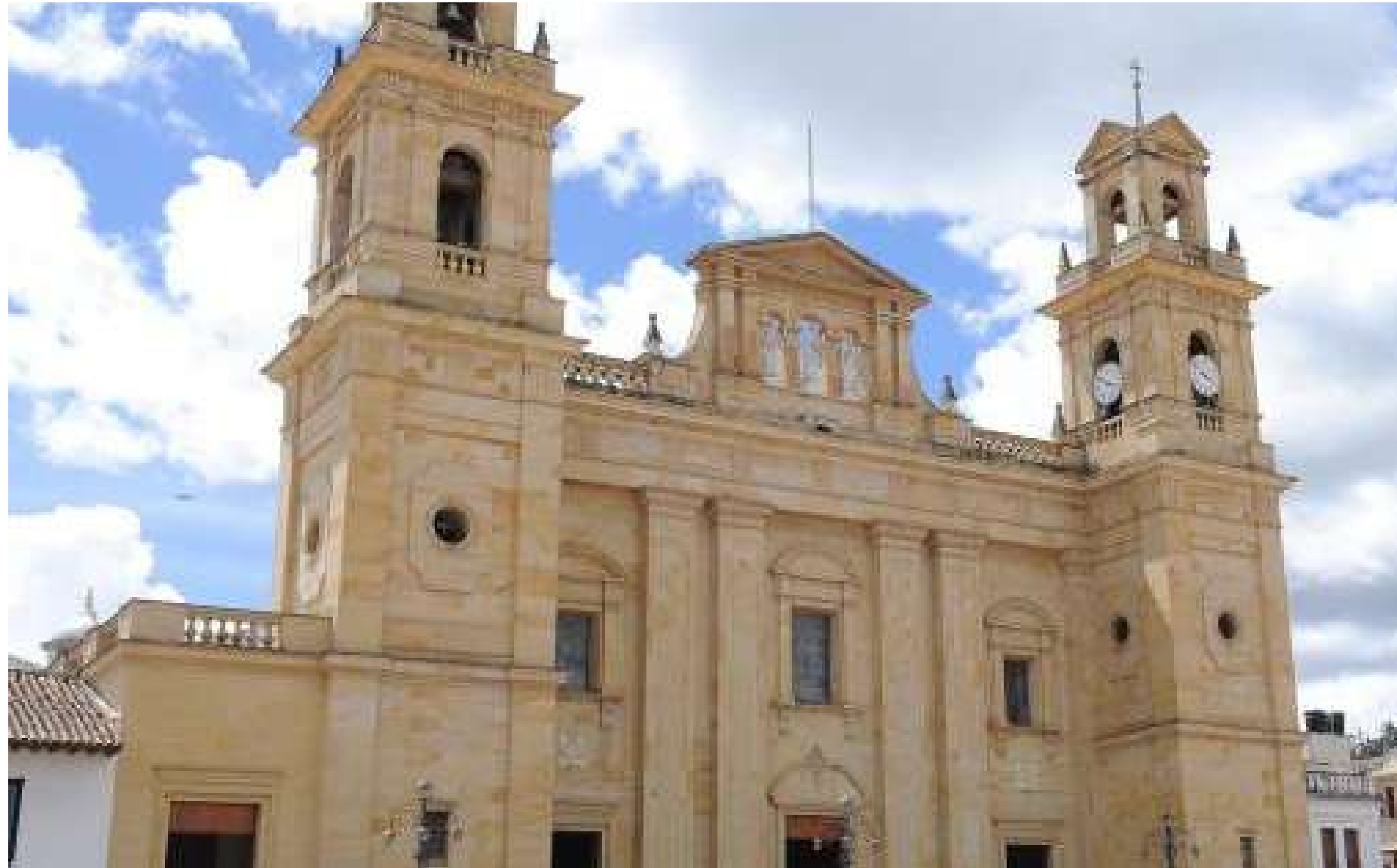
Nuestra Señora del Rosario de Chiquinquirá