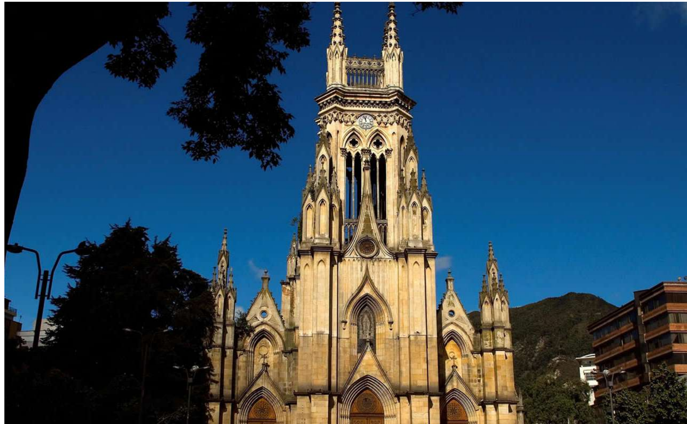
Basílica Menor Nuestra Señora de Lourdes