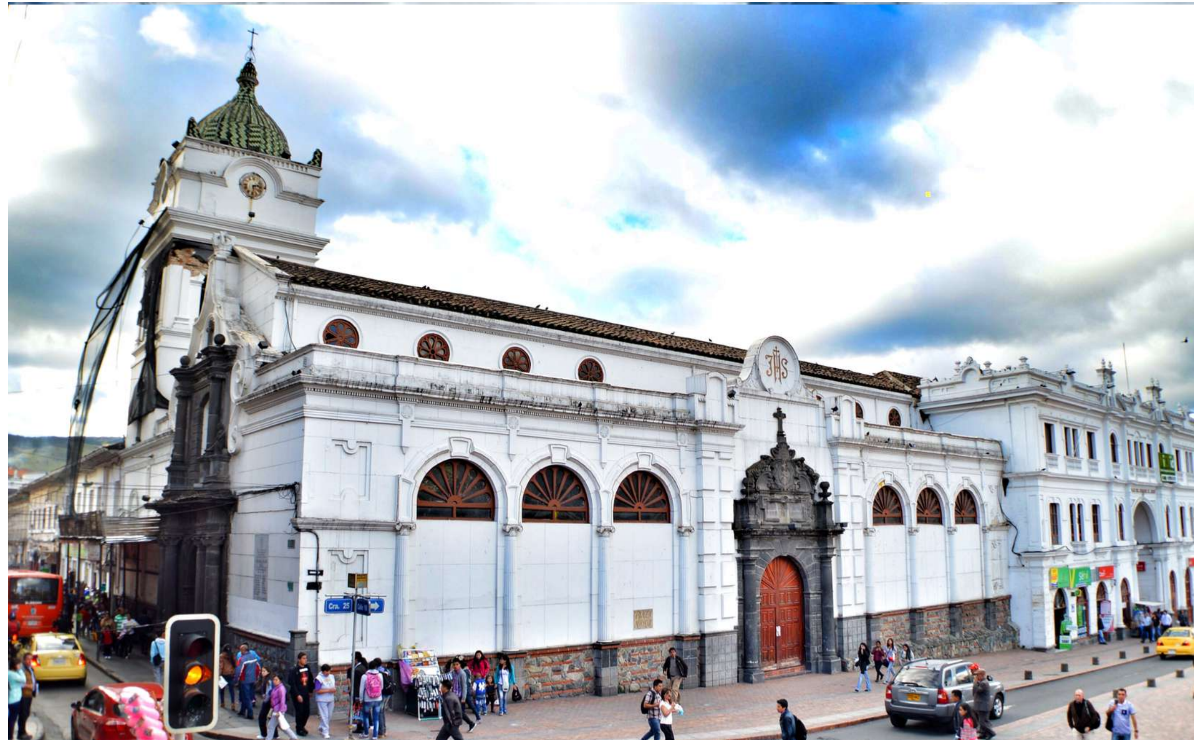
Catedral San Juan Bautista