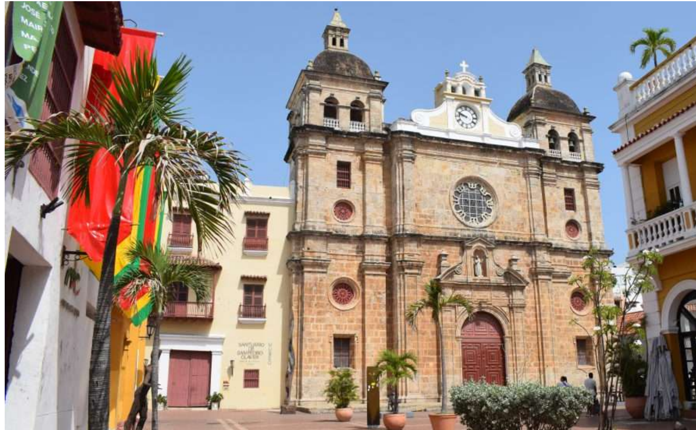
Santuario San Pedro Claver