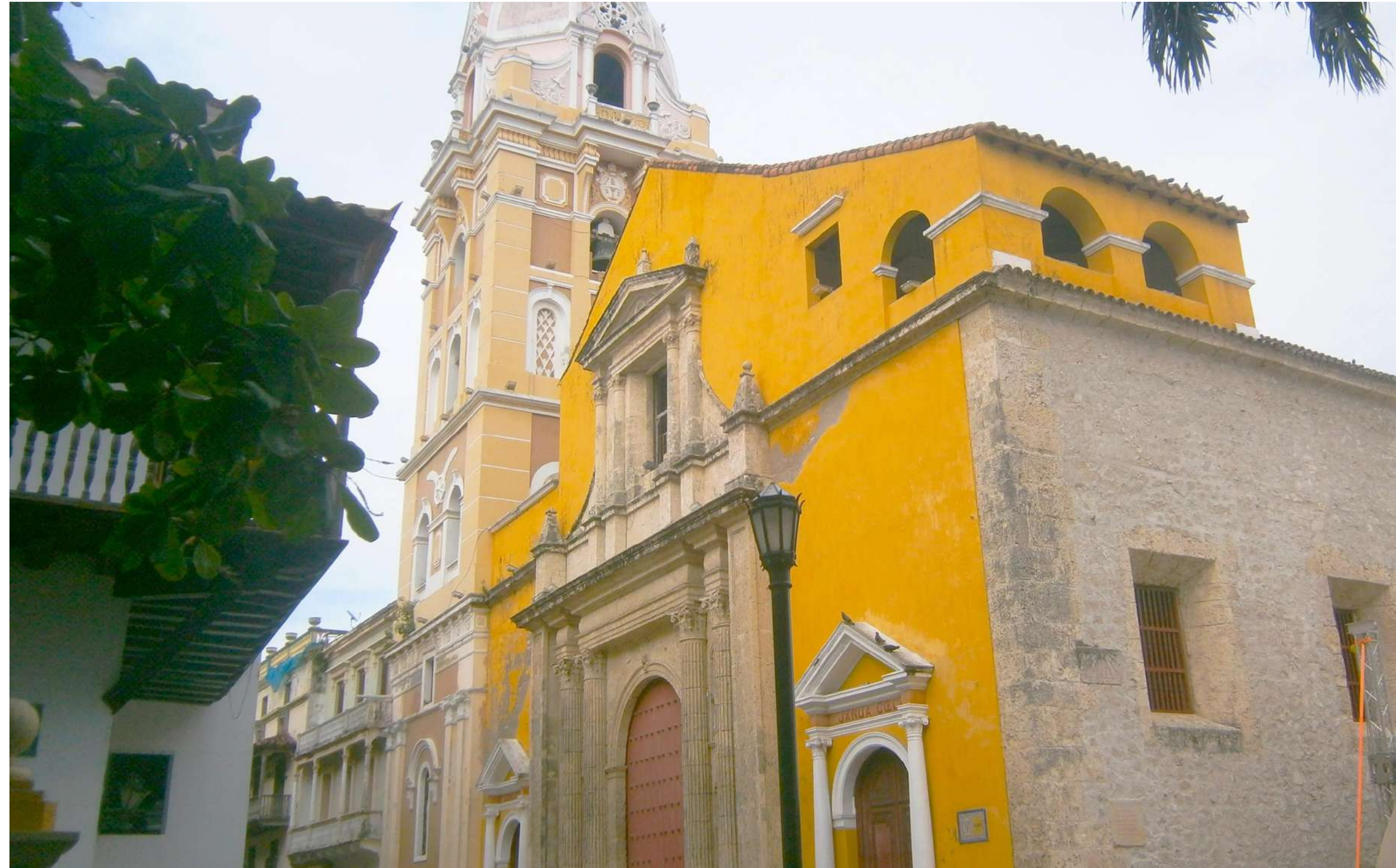
Catedral Santa Catalina de Alejandría