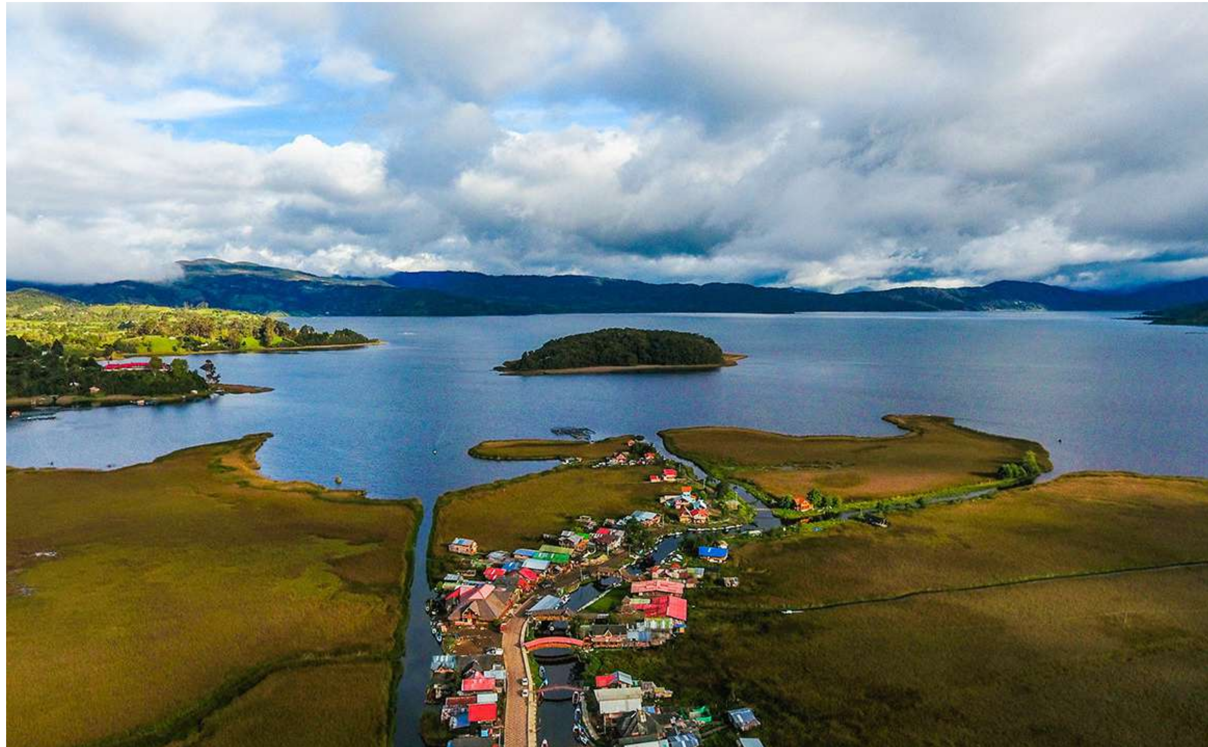
Laguna de la Cocha