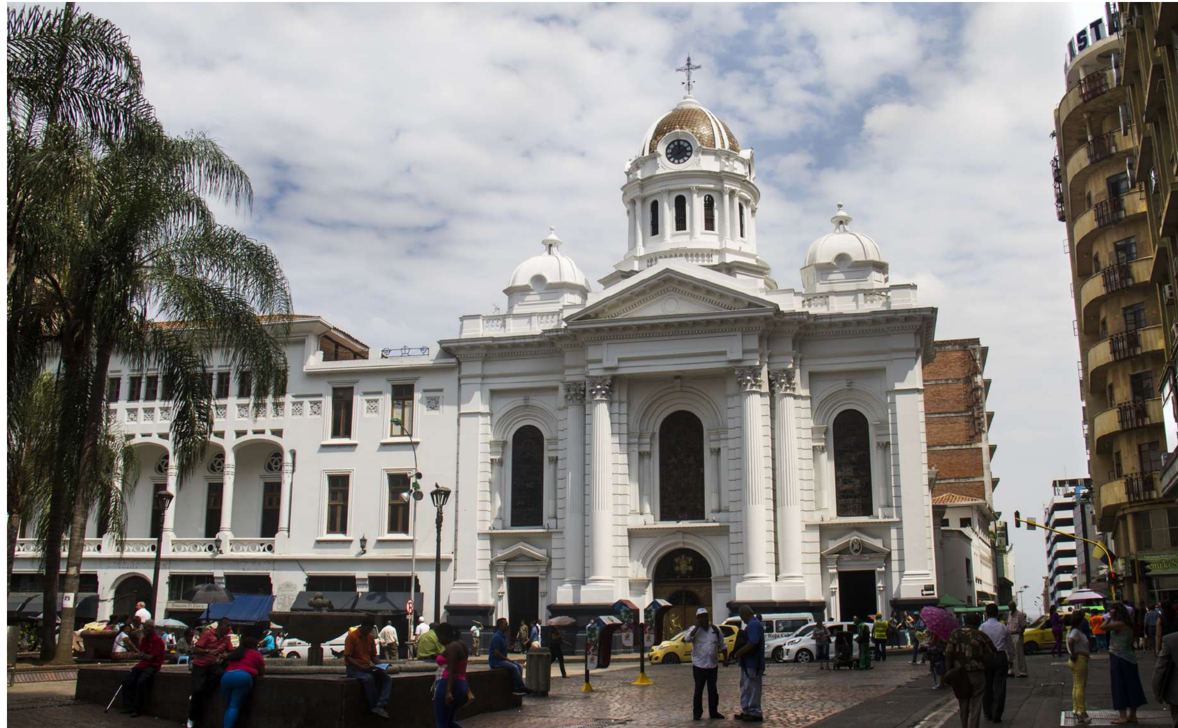
Catedral Metropolitana de Cali San Pedro Apóstol