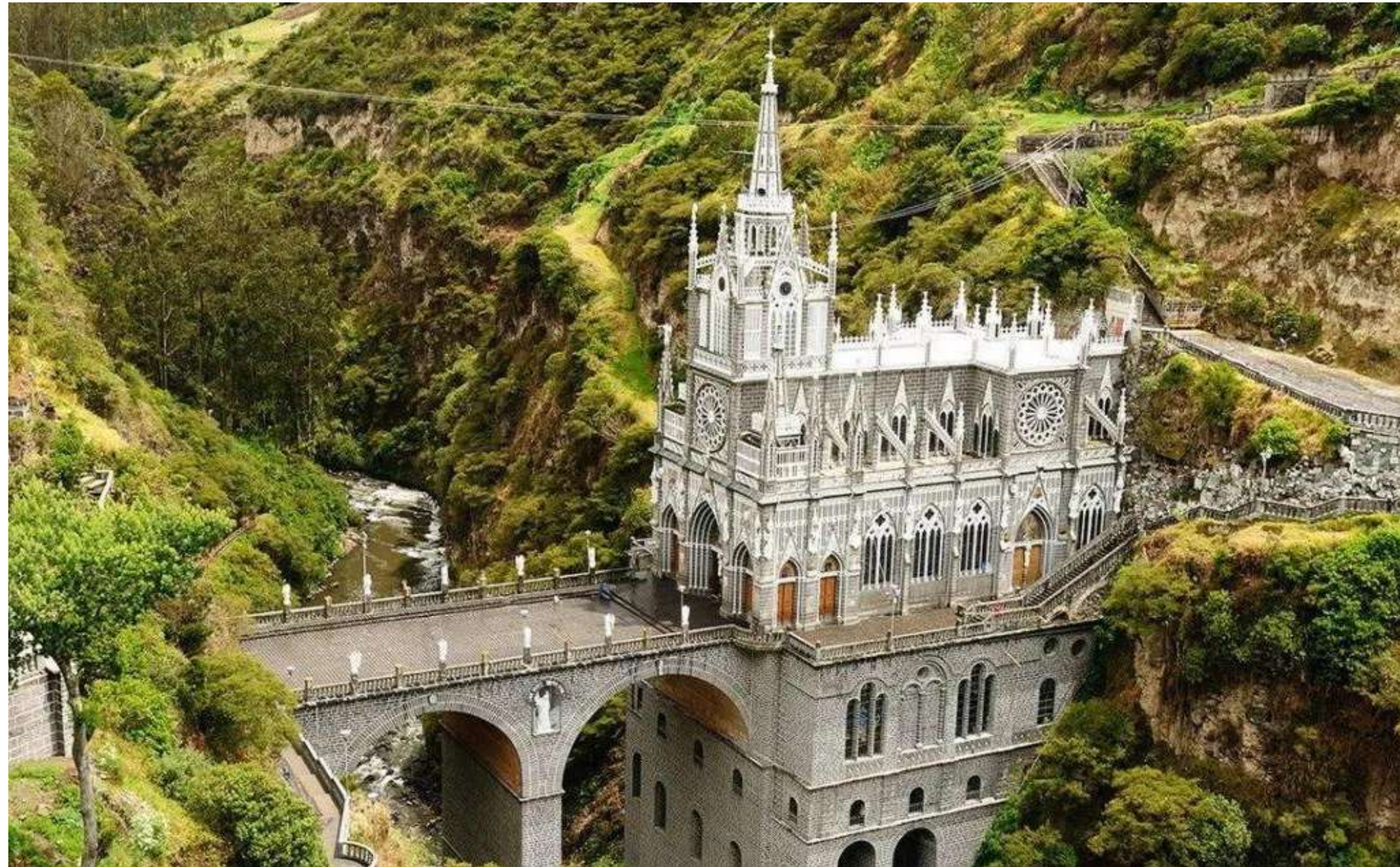
Santuario de Nuestra Señora del Rosario de las Lajas