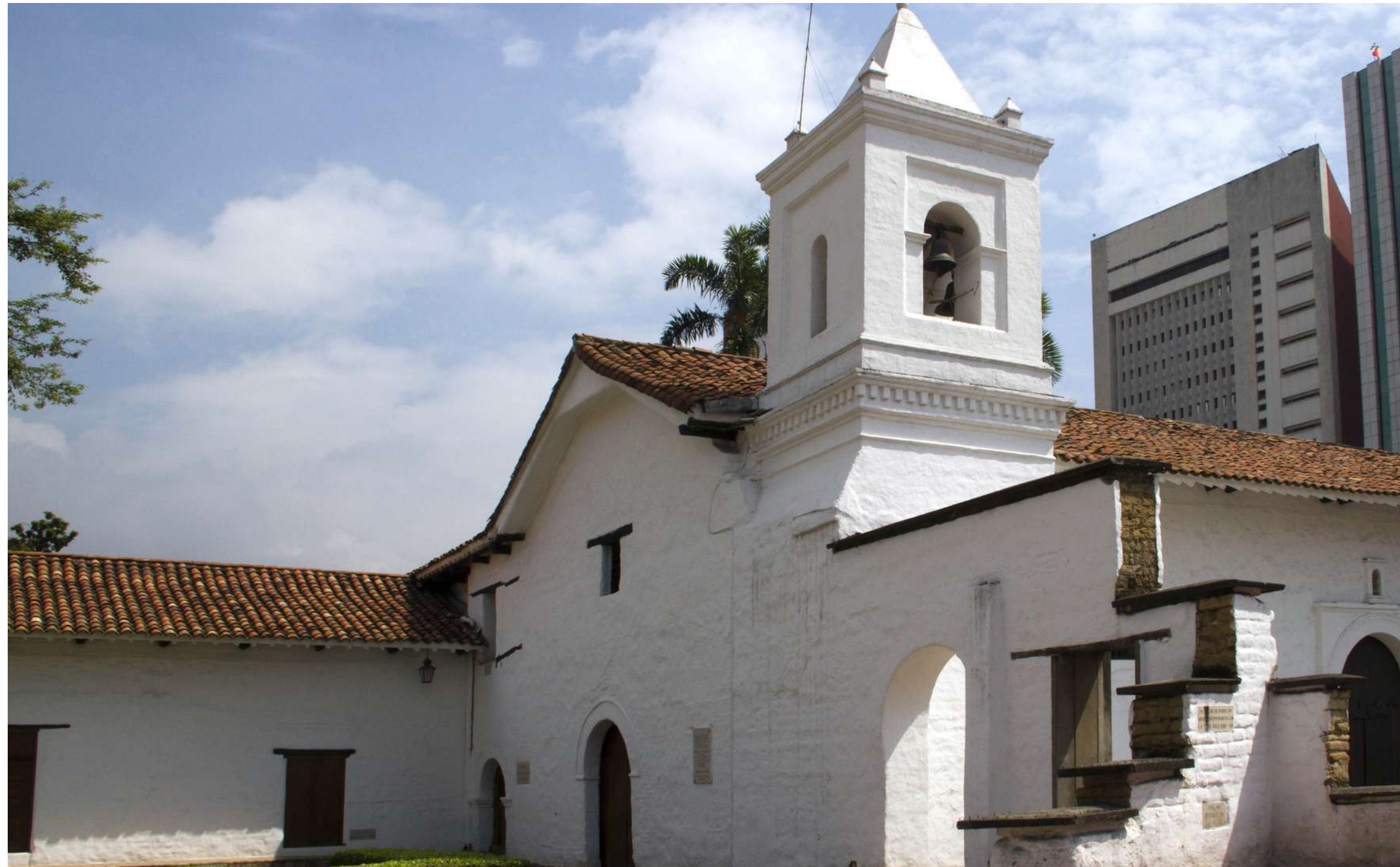
Iglesia de la Merced