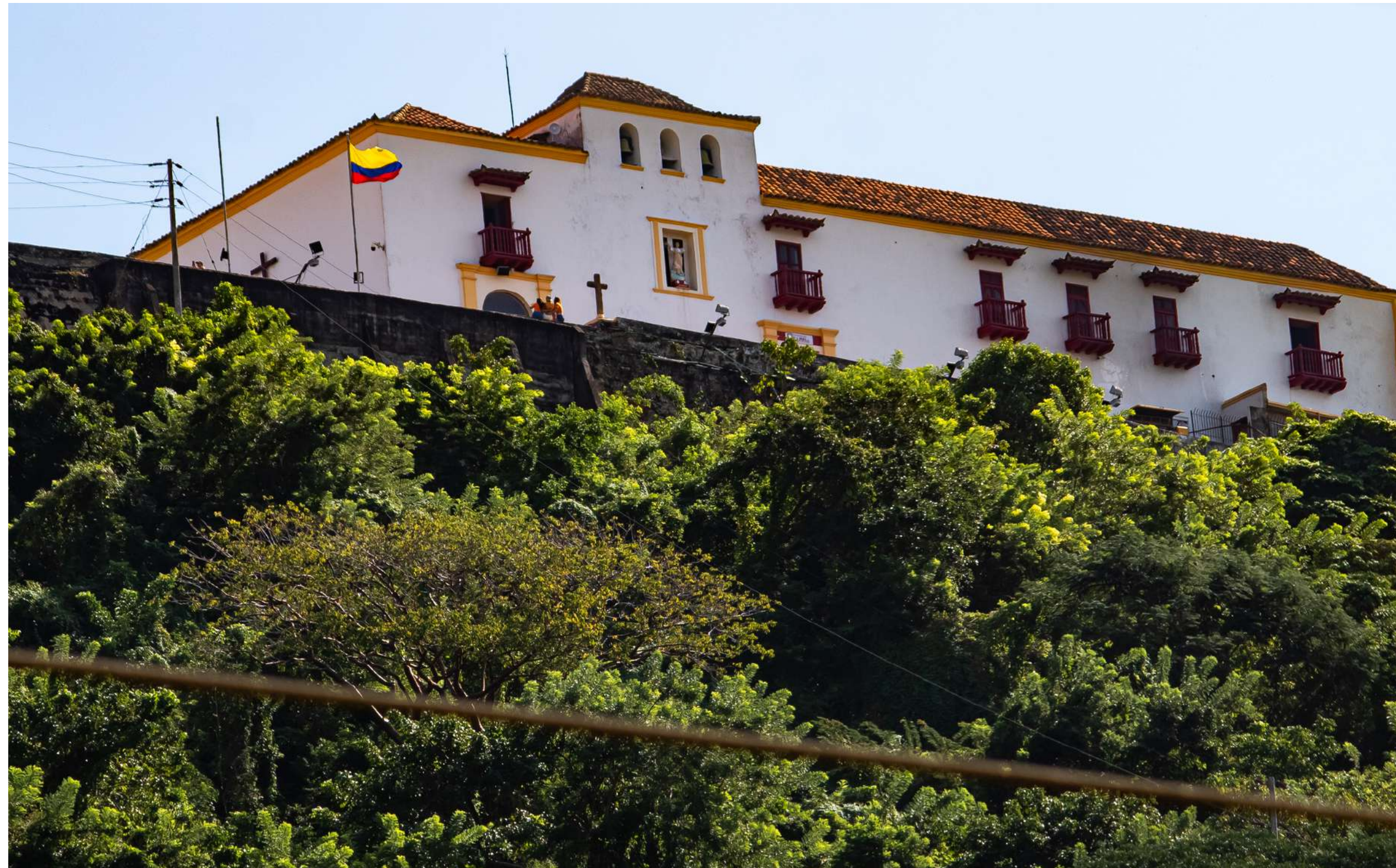
Convento de la Popa de la Galera