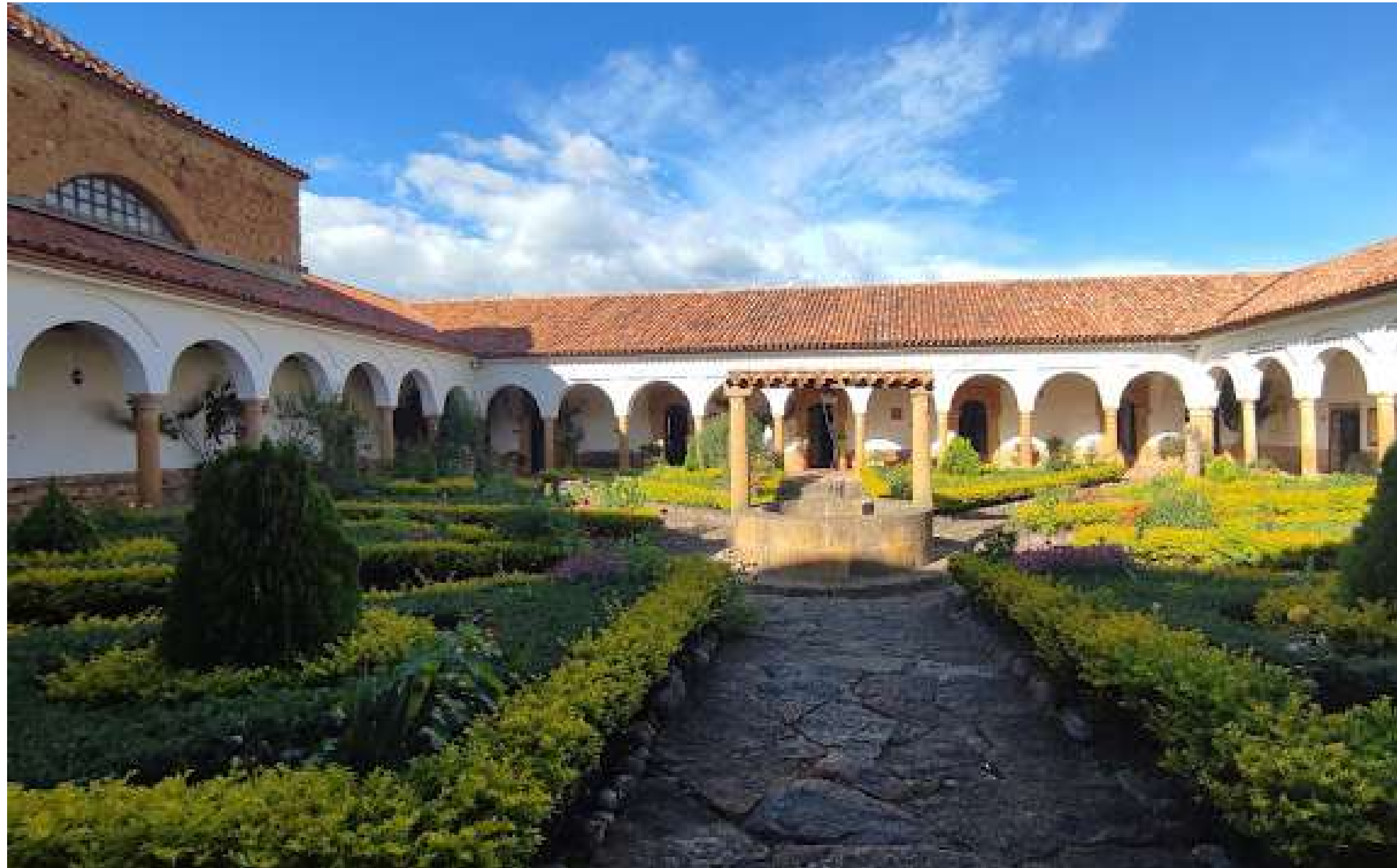
Convento del Santo Ecce-Homo