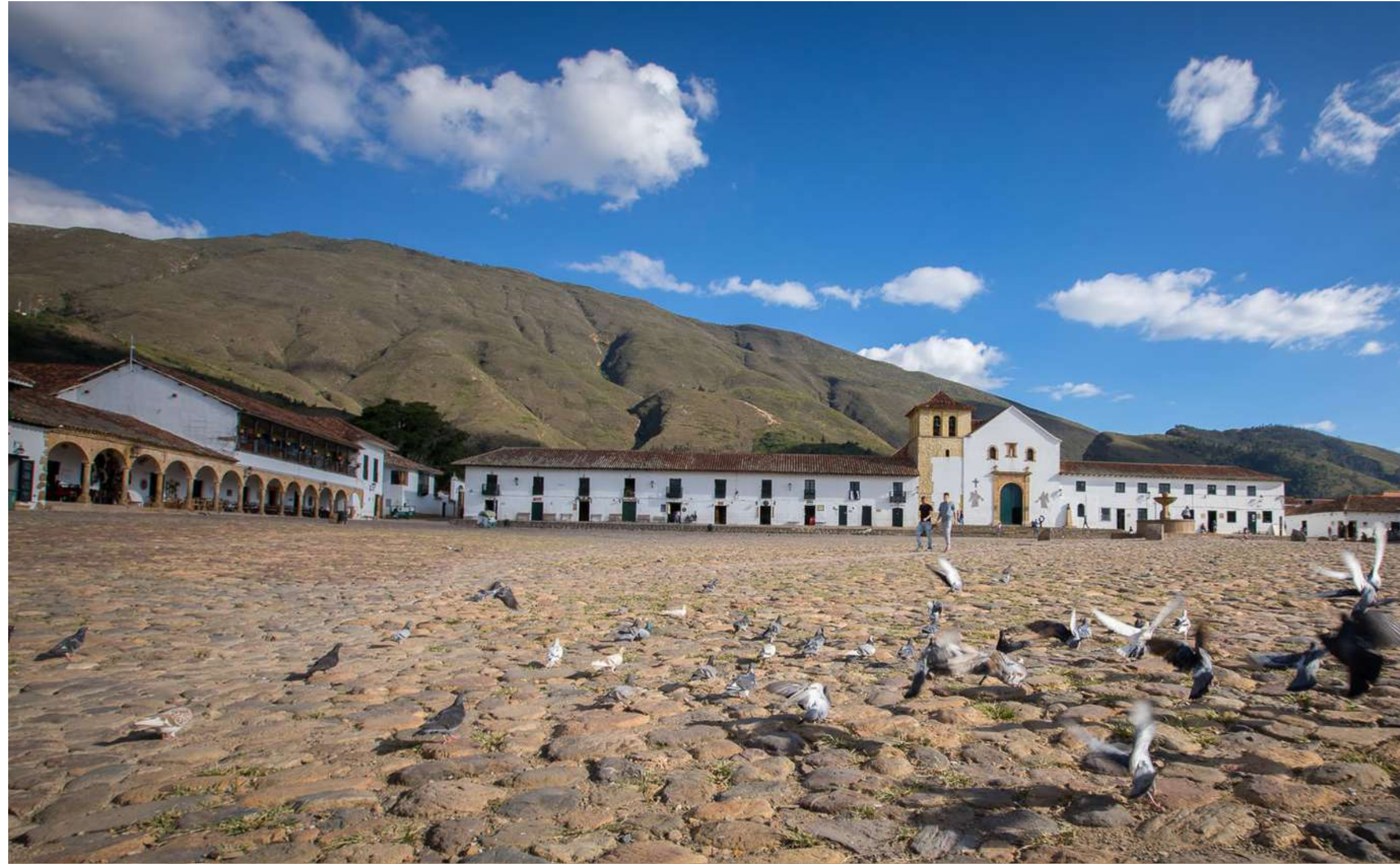
Parroquia de Nuestra Señora del Rosario