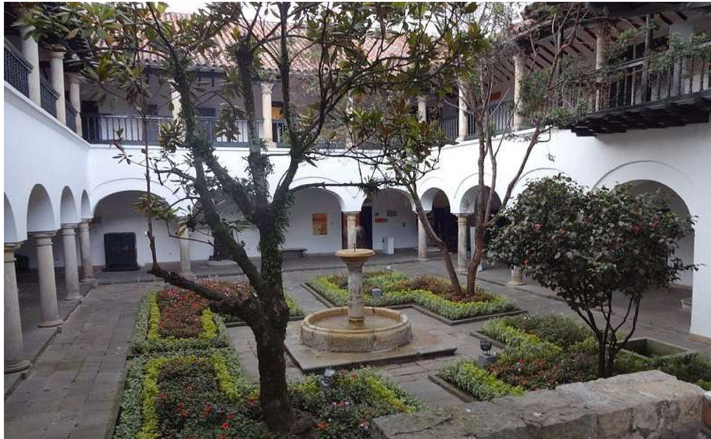
Museo del Arte, Banco de la República