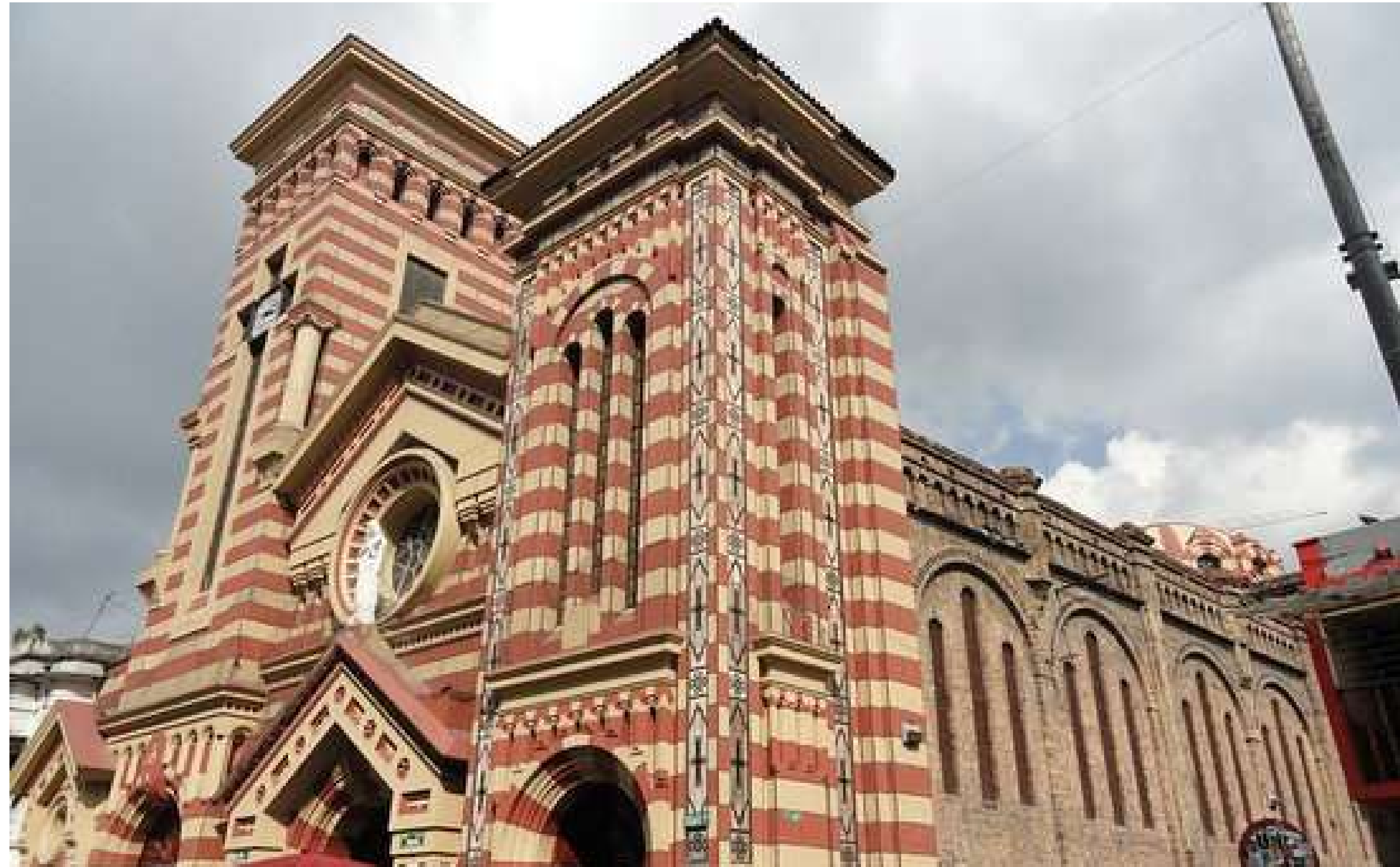
Nuestra Señora de las Nieves