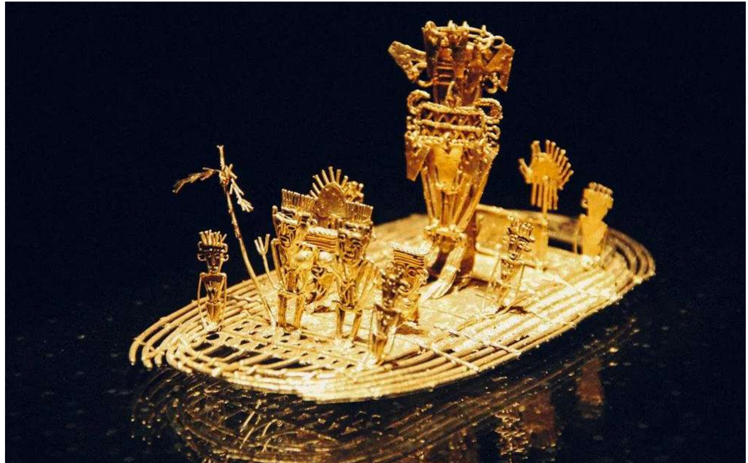
Museo del Oro