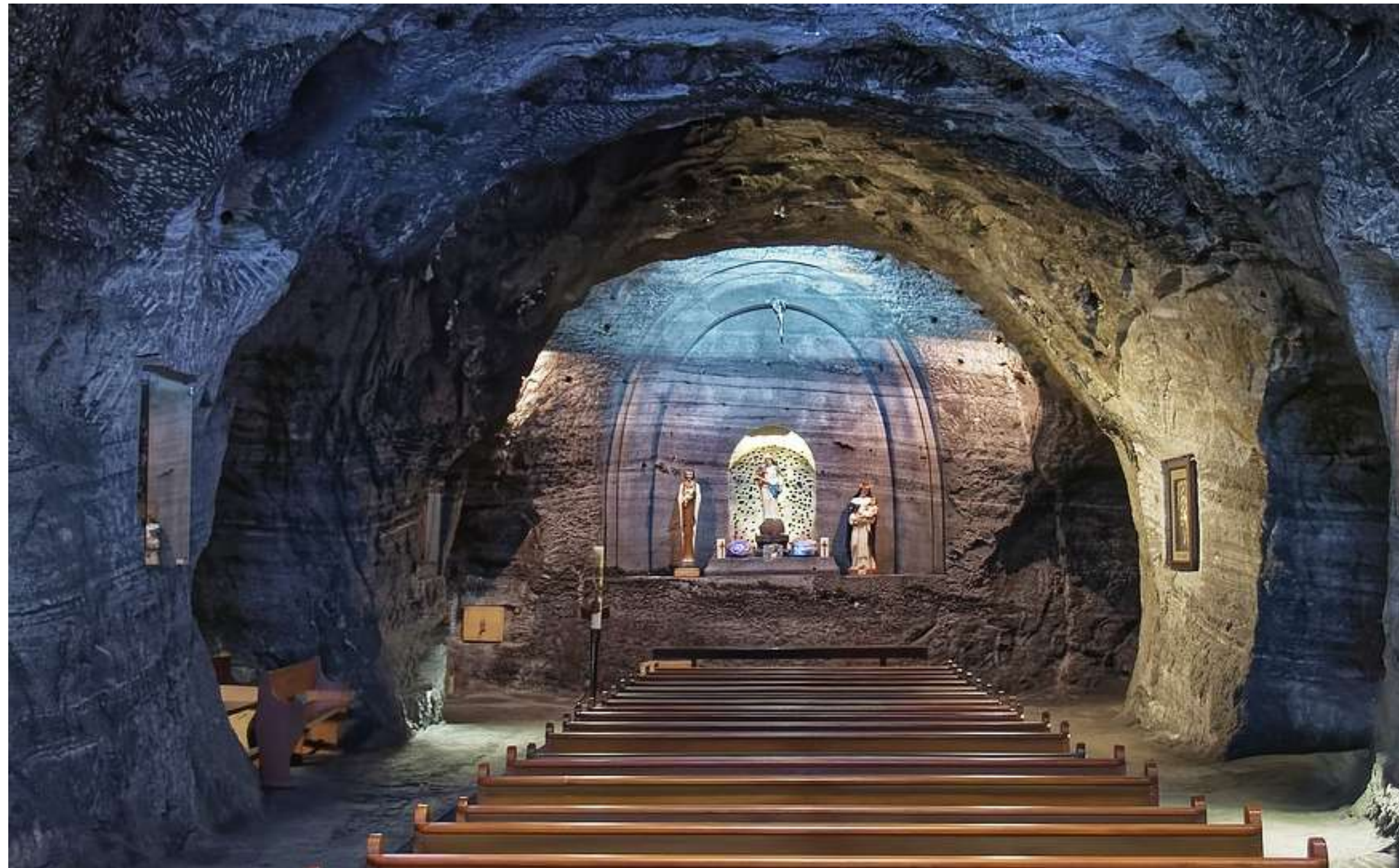
Catedral de Sal de Zipaquirá