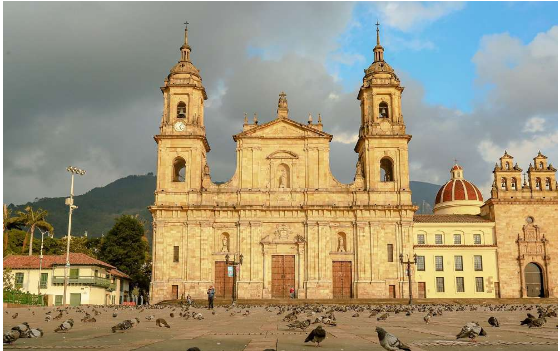
Catedral Basílica de la Inmaculada Concepción