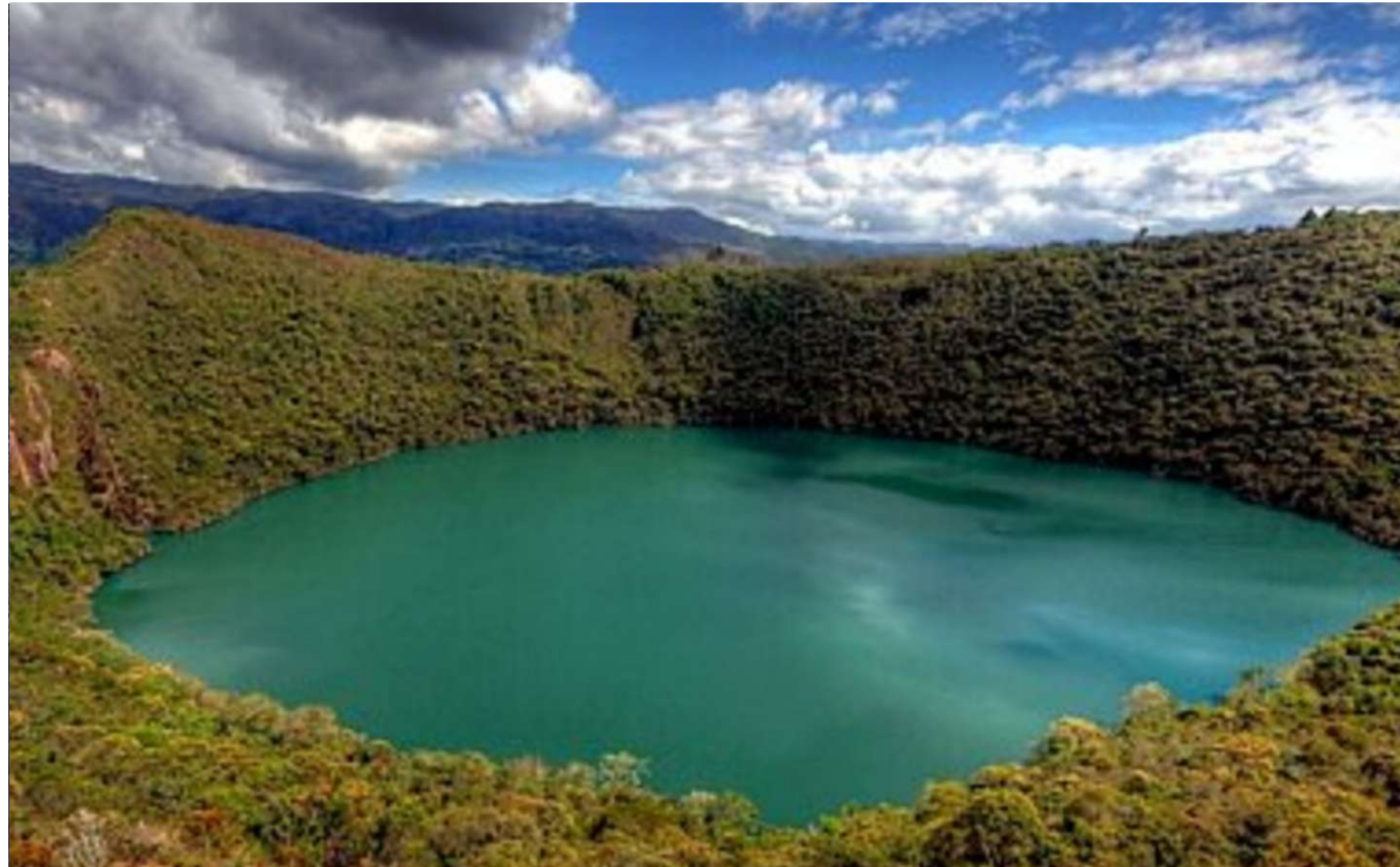
Laguna del Cacique Guatavita