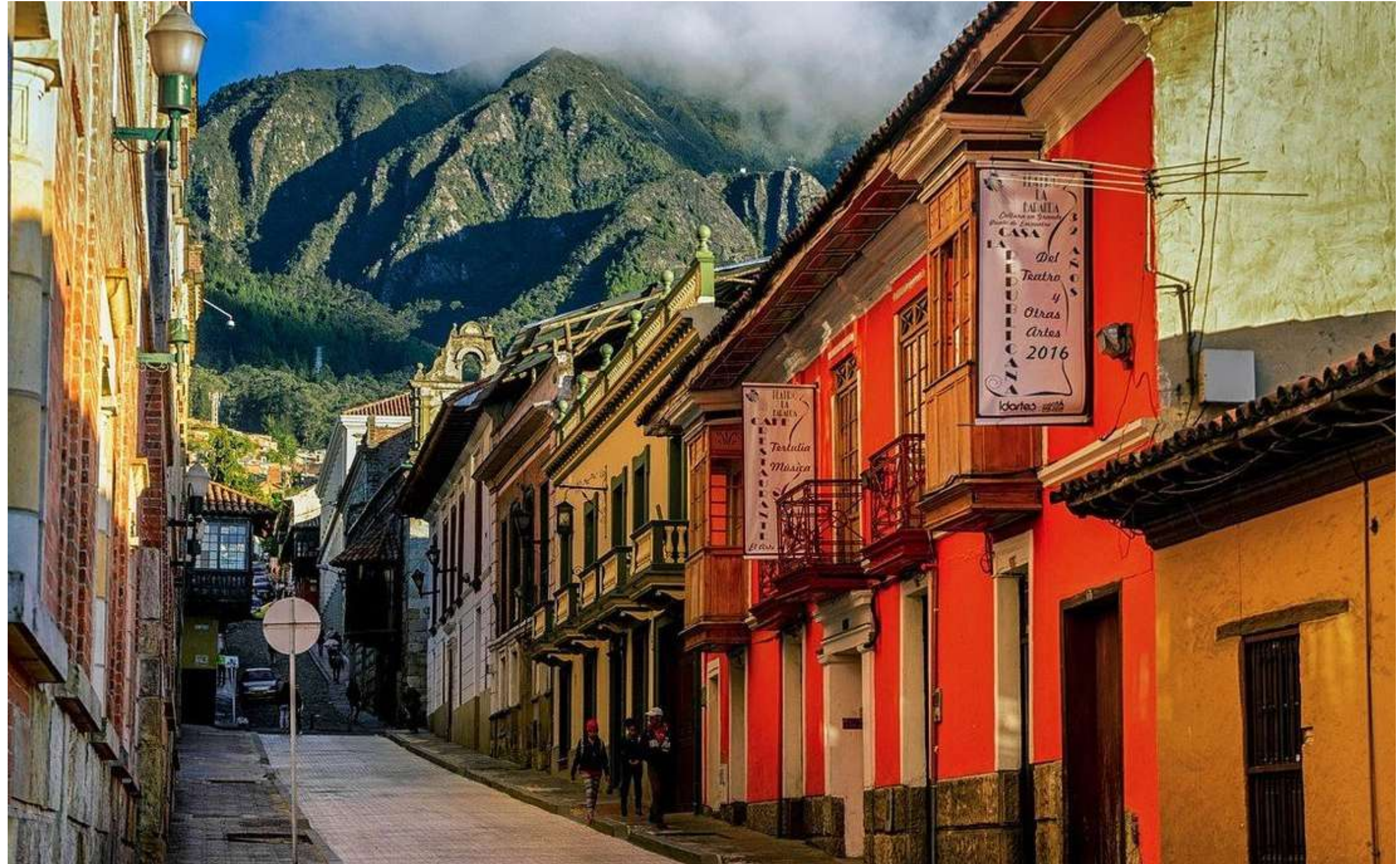
Barrio La Candelaria