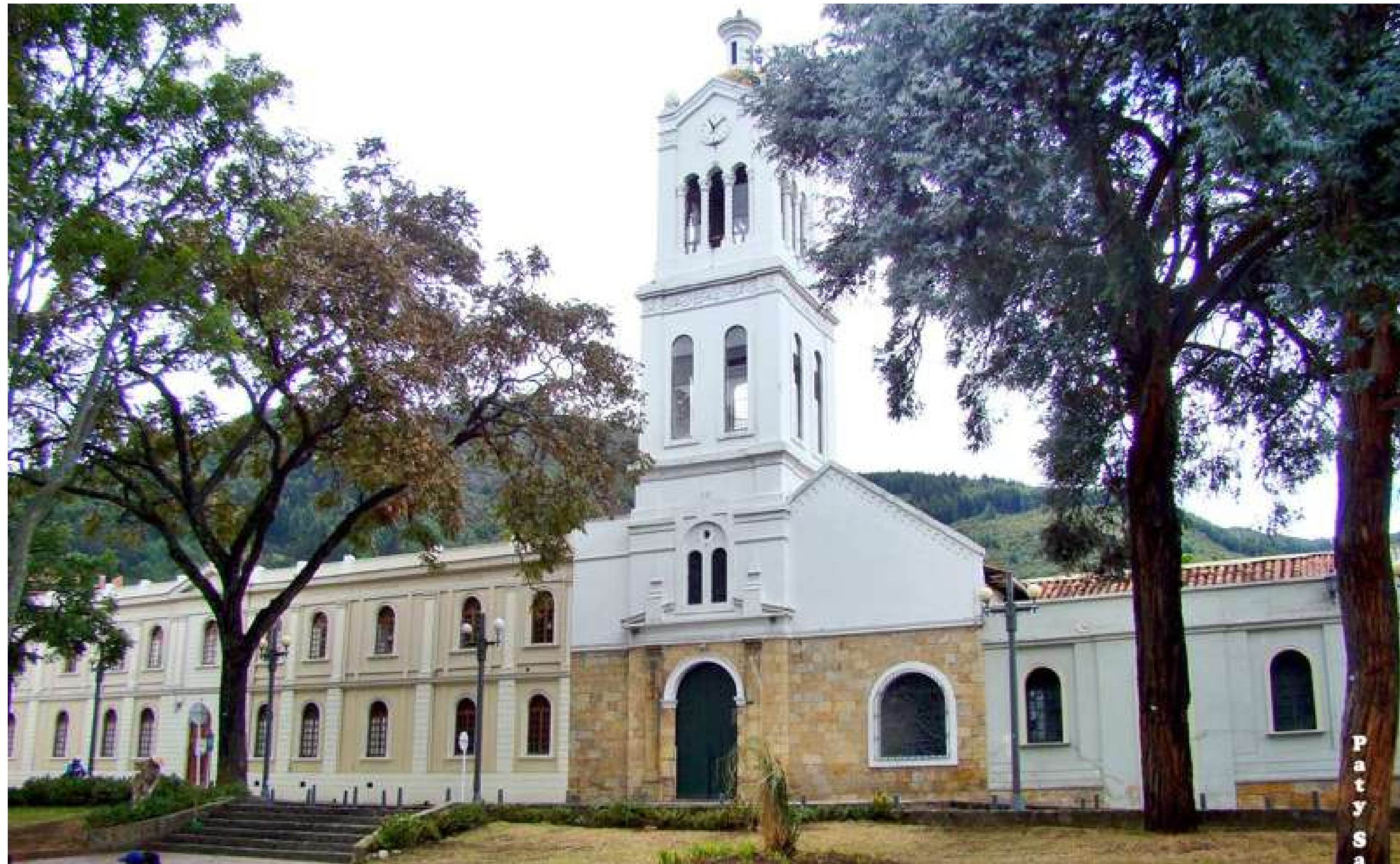
Iglesia de Santa Bárbara