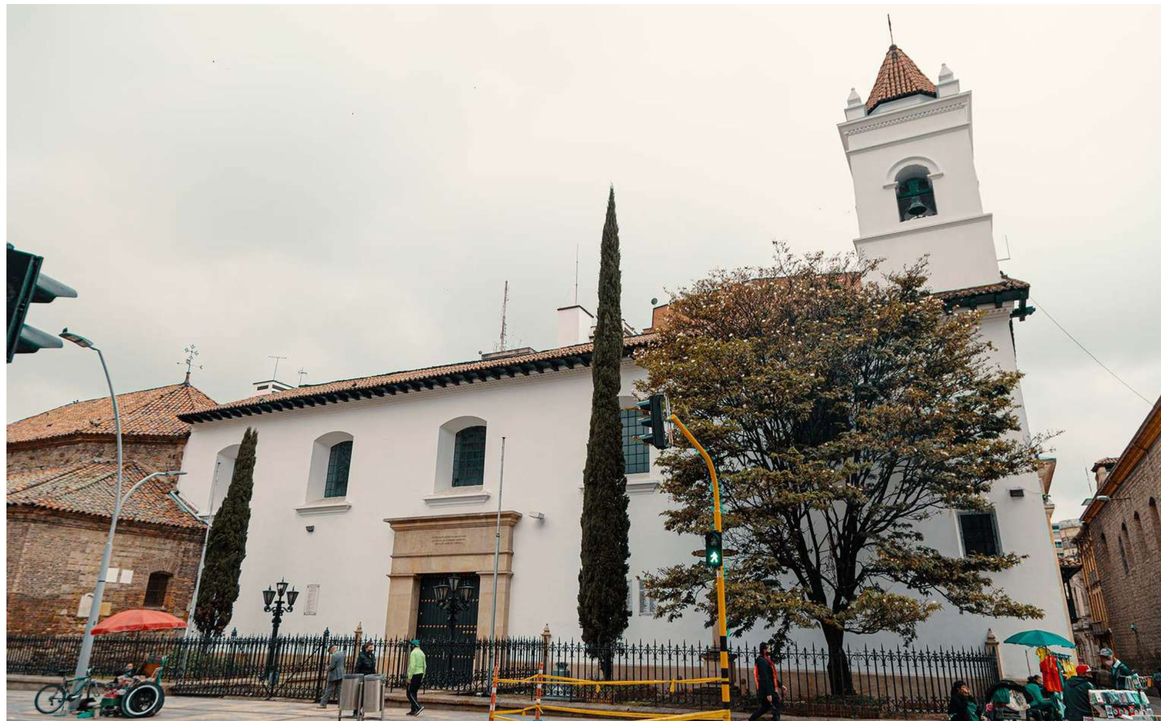
Iglesia de la Veracruz