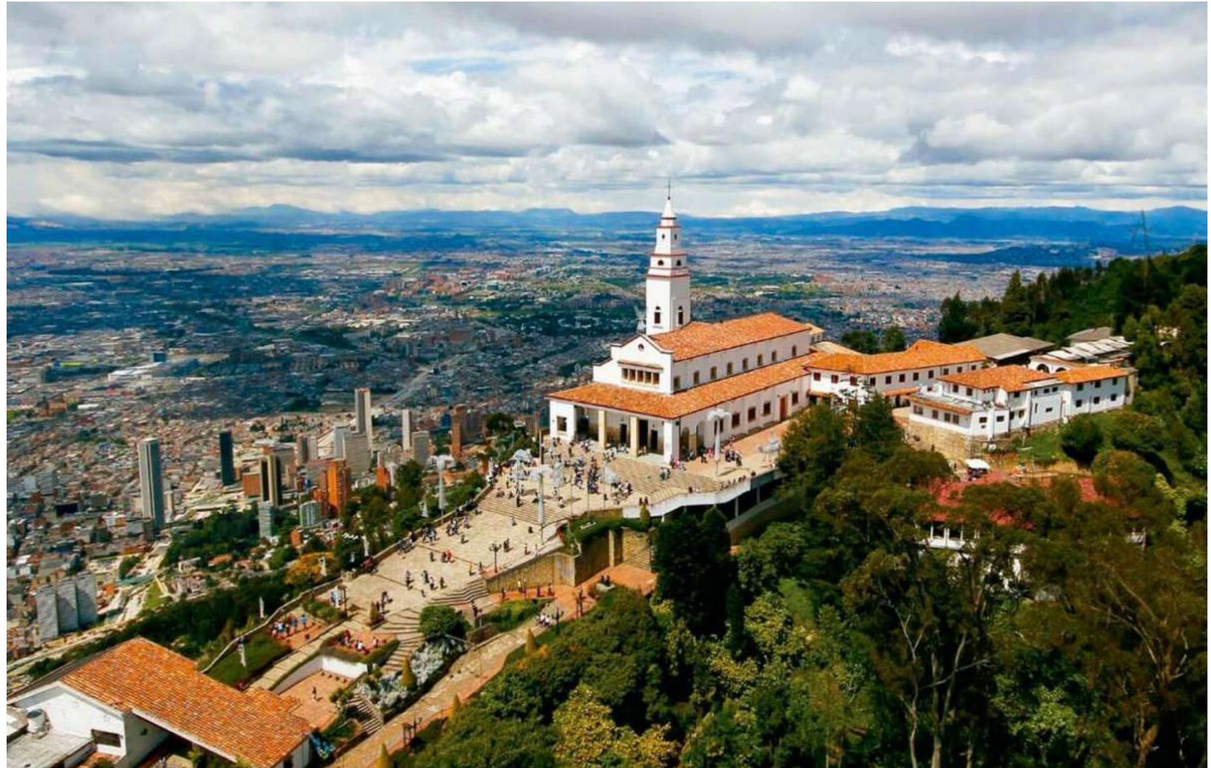
Basílica Santuario del Señor Caído y Nuestra Señora de Monserrate