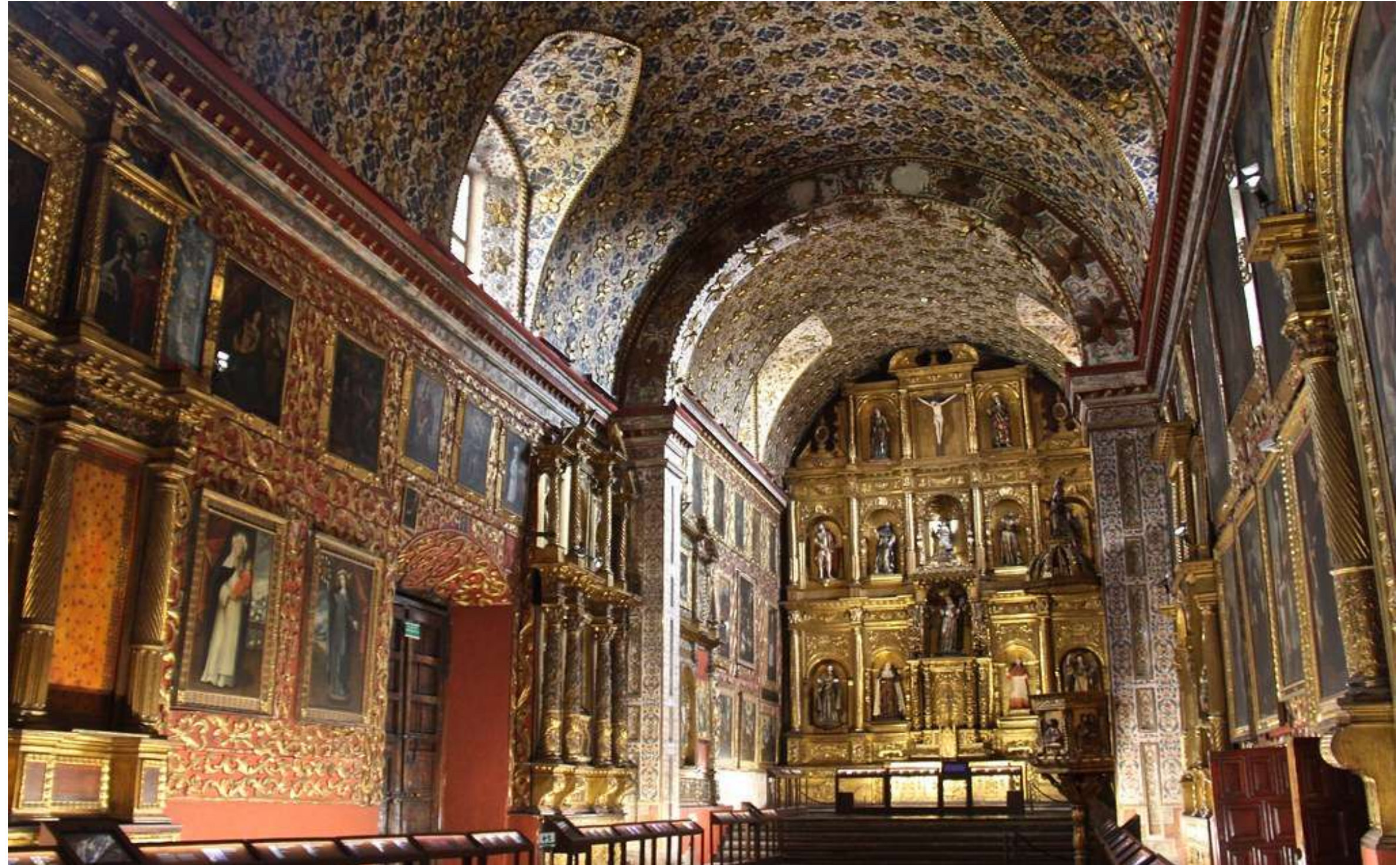
Iglesia Museo Santa Clara