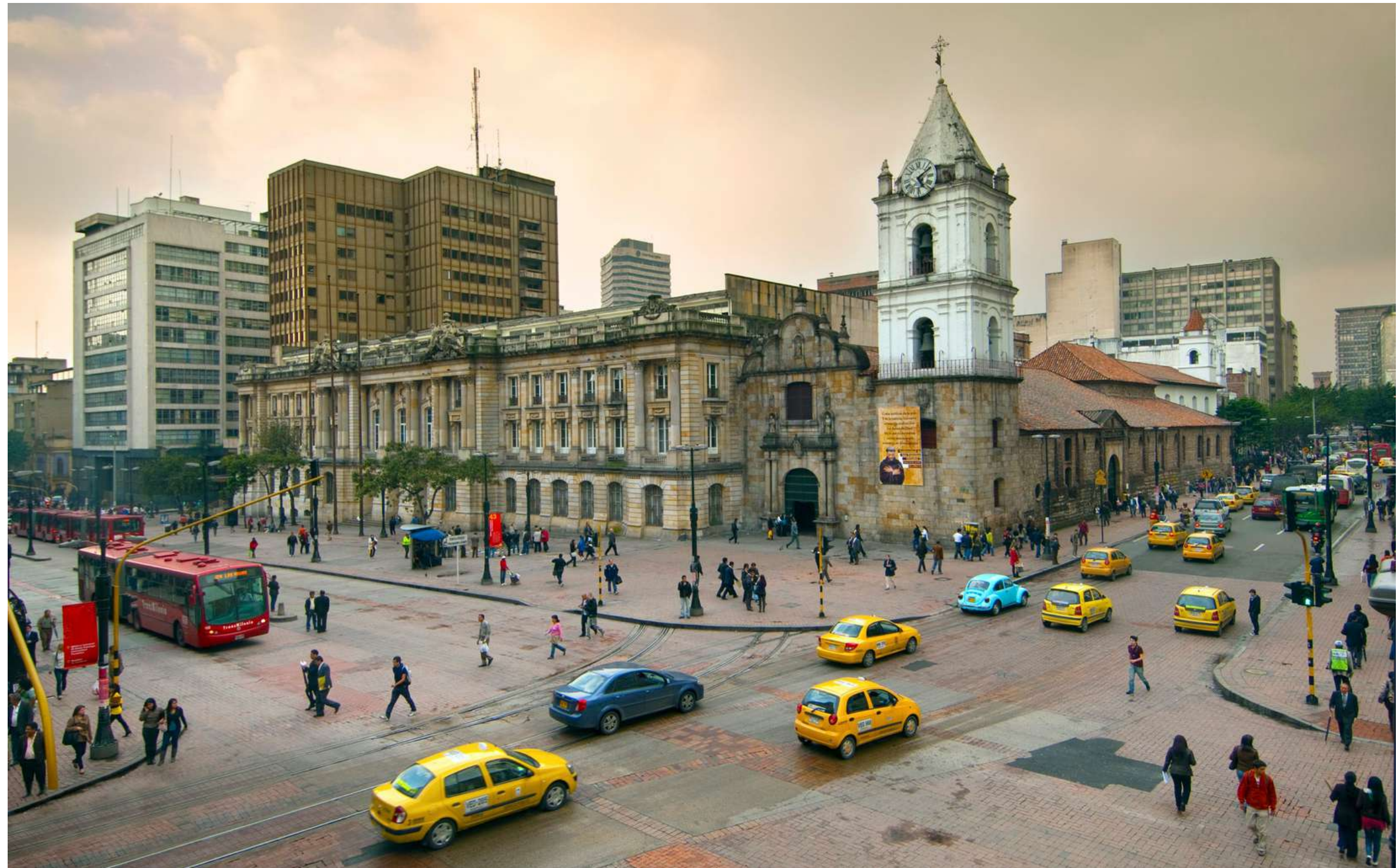
Iglesia de San Francisco