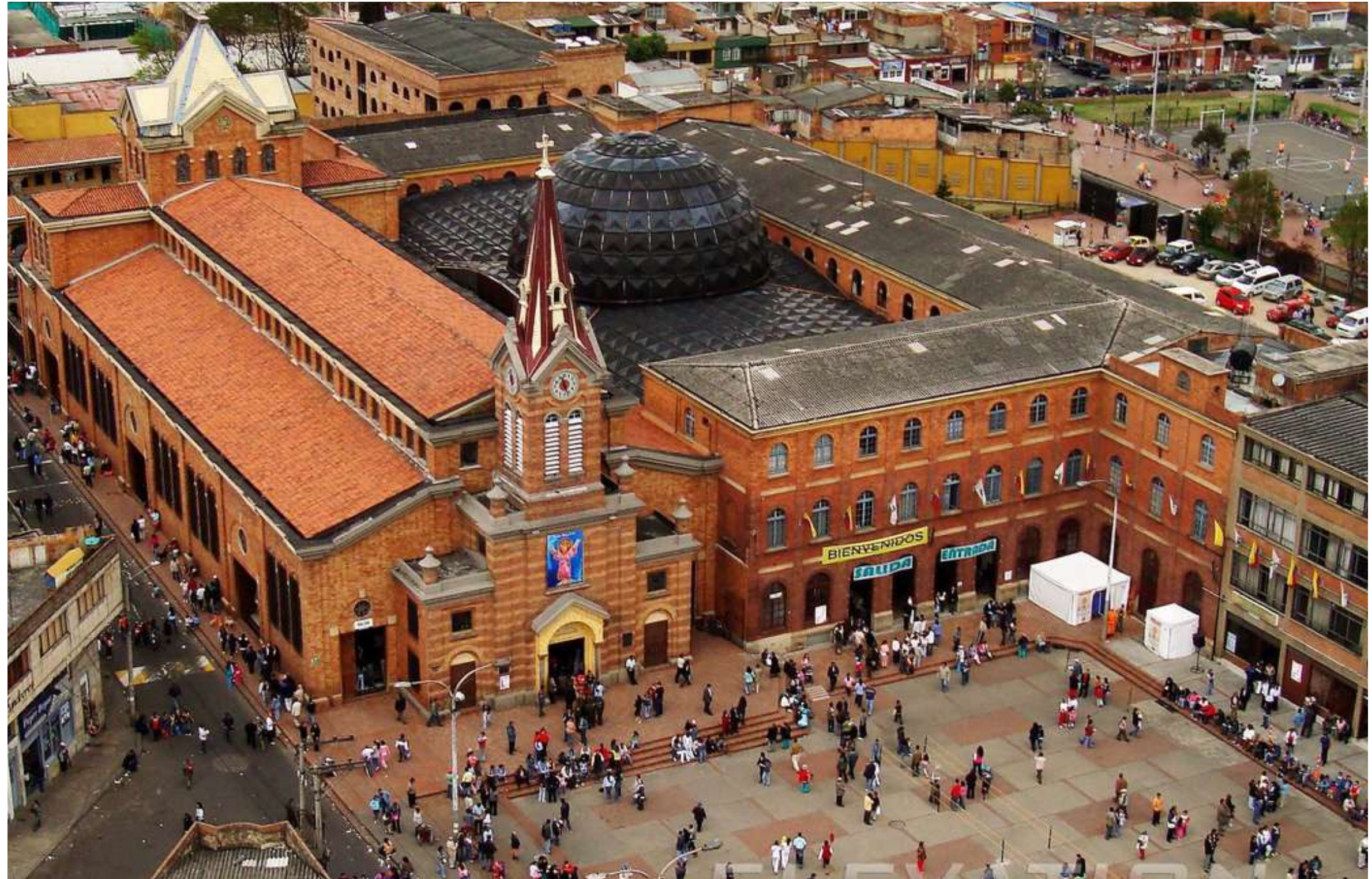
Santuario del Niño Jesús