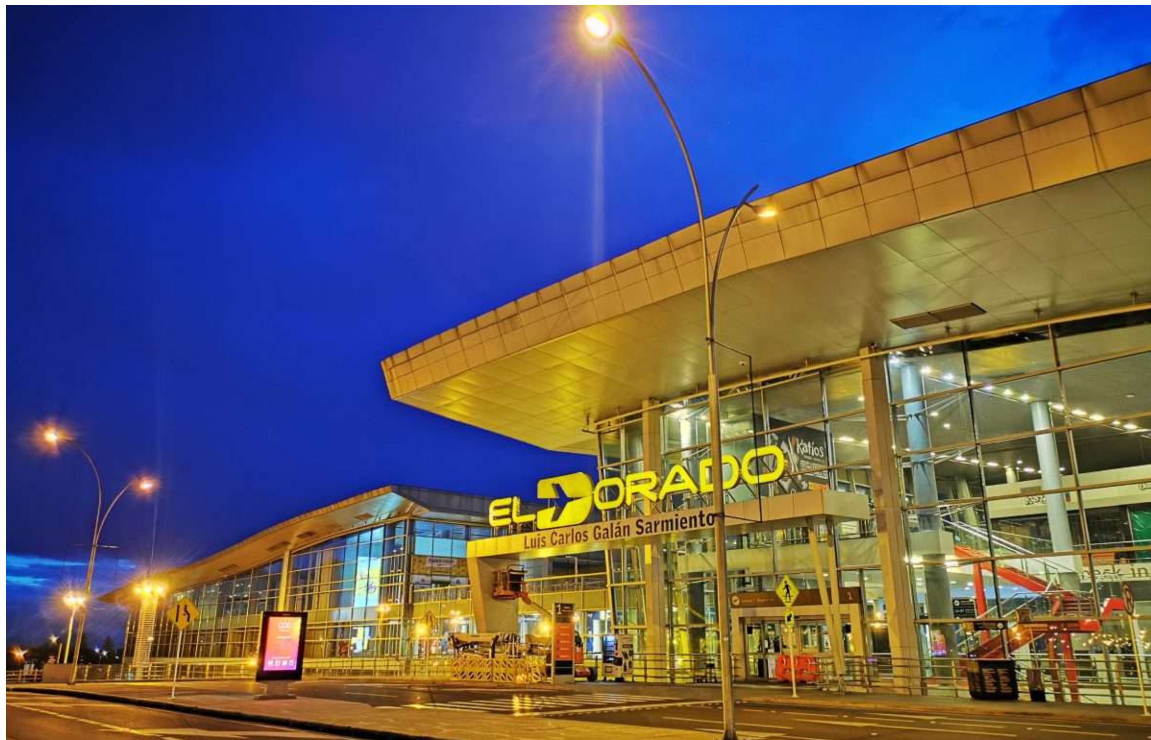
Aeropuerto Internacional El Dorado